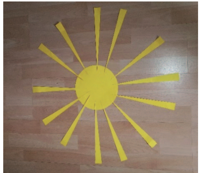
Beispiel: Rad (Zweite Runde)