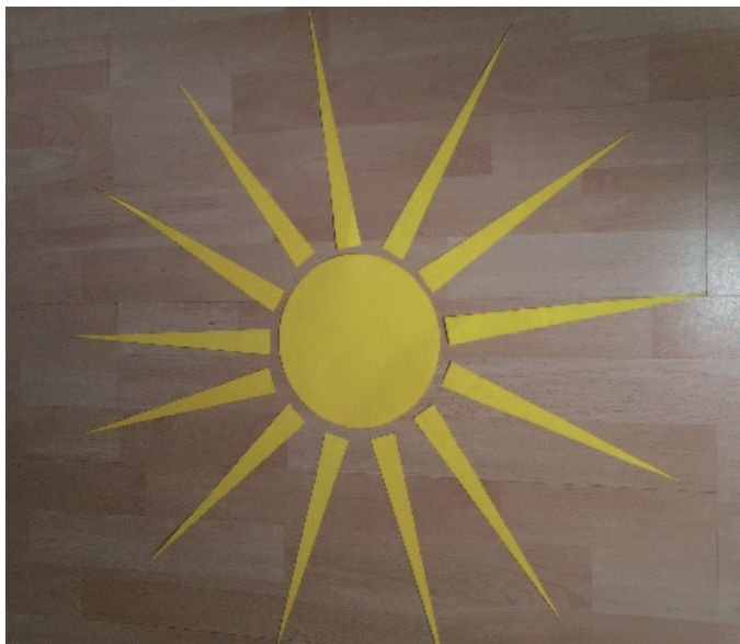
Beispiel: Sonne (Erste Runde)

ZWEITE RUNDE: Nun werden die Strahlen andersherum angelegt und jeder nennt ein Gebetsanliegen. Es entsteht ein Rad mit vielen Speichen: Gemeinsame Fürbitte verbindet, trägt uns und führt durch 'schwere Wege' hindurch.